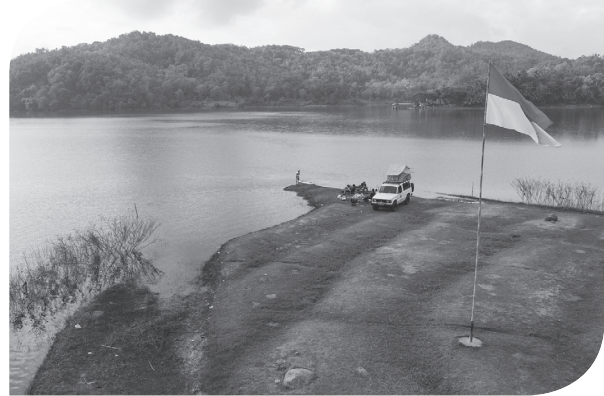
WISATA WADUK SERMO

Pengunjung berada di camping ground Waduk Sermo, Kokap, Kulonprogo, DI Yogyakarta, Kamis (25/8). Waduk Sermo merupakan salah satu destinasi wisata di kawasan dataran tinggi Menoreh yang menawarkan keindahan alam Kabupaten Kulonprogo.